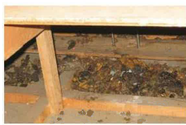
●ハクビシン・アライグマ・イタチなどの糞尿臭・獣臭対策として使用