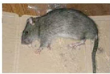
●ネズミなどの死骸臭対策として使用