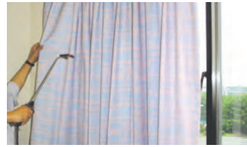
カーテンなどに染み付いたニオイに、消臭抗菌液を噴霧します。