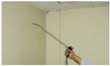
天井や壁などに付いたニオイに、消臭抗菌液を噴霧します。