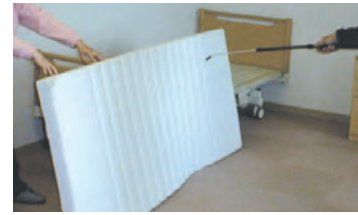
気付きにくいベッドやマットレスに染み付いたニオイに消臭抗菌液を噴霧します。