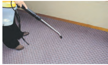
ジュウタンなど特にニオイが染み付きやすいため入念に消臭抗菌液を噴霧します。