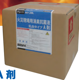
FU-11 火災現場用 消臭抗菌液 乳白タイプ A 剤

火災で発生する焼け焦げ臭は、クロスや床材、家具、家電品、生活雑貨などあらゆる物が燃焼し、天井や壁面、残った家財や建材に染み付いた状態になっています。その中にはホルムアルデヒドやダイオキシンなどの有害物質を含んでいる場合も多く、徹底した消臭ケアが大切です。