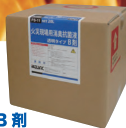
FS-11 火災現場用 消臭抗菌液 透明タイプ B 剤

一般住宅など幅広い場所に使用でき消臭効果を発揮します。主に一般住宅などの下地用として使用します。