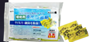
HB-10 環境用衛生除菌剤