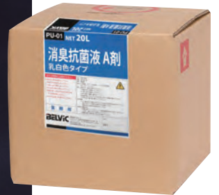
PU-01 消臭抗菌液 A 剤乳白タイプ