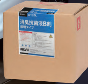
PS-01 消臭抗菌液 B 剤透明タイプ